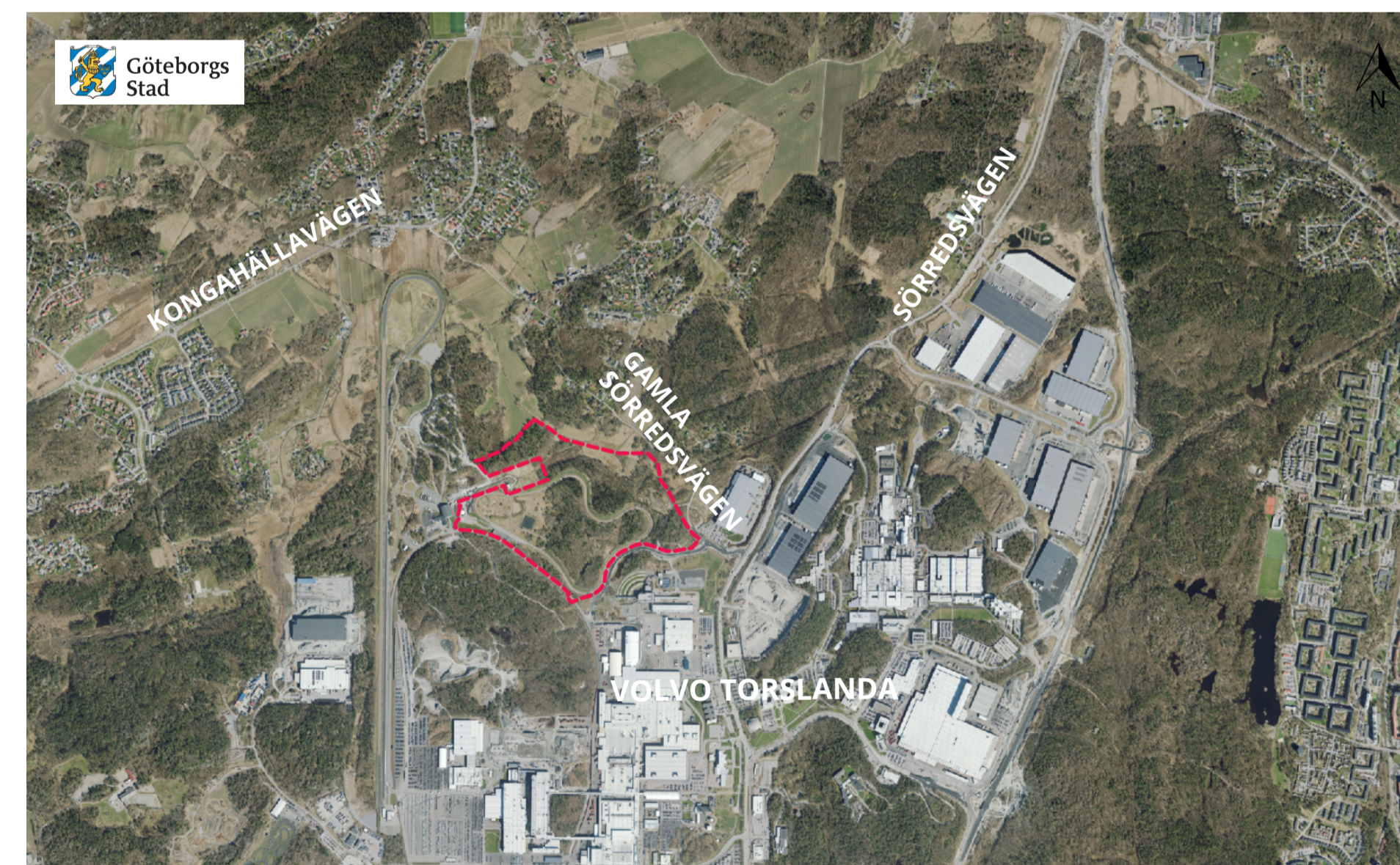
Planområdets placering i närområdet. Planområdet är redan idag del av Volvo Torslandas industriområde. Området ansluter till Gamla Sörredsvägen via Sörredsvägen.